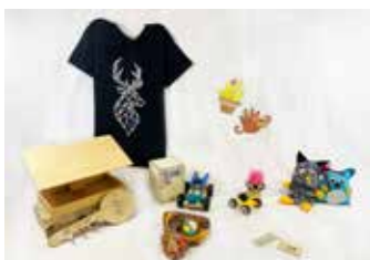
Angebote zum Basteln, Werkeln, Experimentieren am Internationalen Kindertag

Beim Kindertags-Wochenende im TJP e.V. stehen Spiel und Spaß im Vordergrund: zahlreiche Do-it-yourself-Angebote rund um Technik, Handwerk und Kreativität können ausprobiert und Hintergrundwissen zu den spielerischen Angeboten im Quizparcours erweitert werden. Kleine Forscher:innen lassen Riesenseifenblasen fliegen und lernen, wie sie mithilfe der Chemie eine kleine Schaumparty veranstalten. Sie stellen Schleim her und testen eine kuriose Flüssigkeit, die mal fest, mal flüssig ist. Der kindlichen Neugier, Dingen auf den Grund zu gehen, wird der Becher des Pythagoras gerecht. Einen Einblick in moderne Fertigungstechniken erlangen kleine und große Interessierte beim Personalisieren eines Holzanhängers mit moderner Lasergravur, durch das Kreieren eines eigenen Namens-