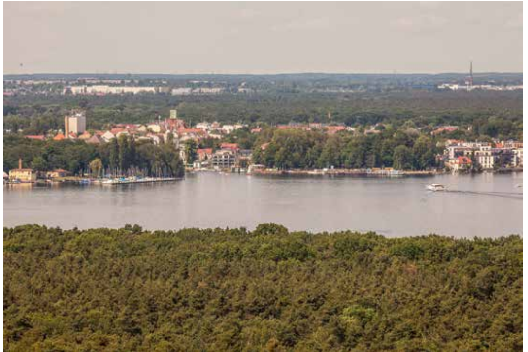
Eintauchen ins wilde Berlin – rund um den Müggelsee ein leichtes Vergnügen. Auch am Langer Tag der StadtNatur.

So lädt z.B. der Technische Jugendbildungsverein in Praxis e. V. unter dem Titel „Natur entdecken: Die Bedeutung des Wassers“ Interessierte ab 8 Jahren zu einer Spurensuche mithilfe von GPS-Geräten ein. Zehn versteckte Orte zwischen dem Köpenicker Teufelssee und dem großen Müggelsee werden angelaufen. Der Weg führt von einem Wasserspeicher-Wald über ein CO 2 -Speicher-Moor weiter zu einem durch Dürre geschädigten Wald bis zum großen Nutz- und Erholungssee. Dreimal findet an dem Wochenende dieses 2 bis 3 Stunden dauernde Angebot statt.