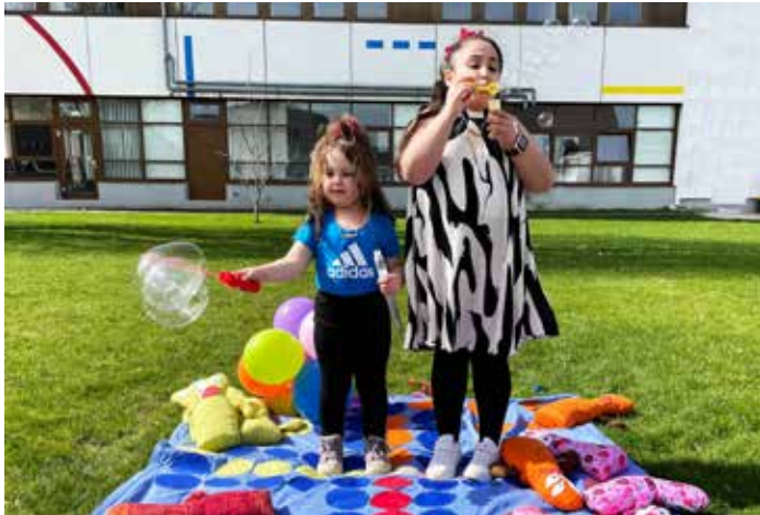
Spiel und Spaß im Außenbereich am Internationalen Kindertag