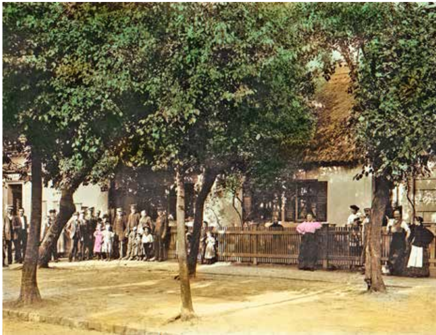
Das Foto aus dem Jahr 1898 zeigt das Haus Nr. 7 noch bevor es zur „Reeperbahn“ umgebaut wurde.

Eine „sündige Meile“ in Friedrichshagen?