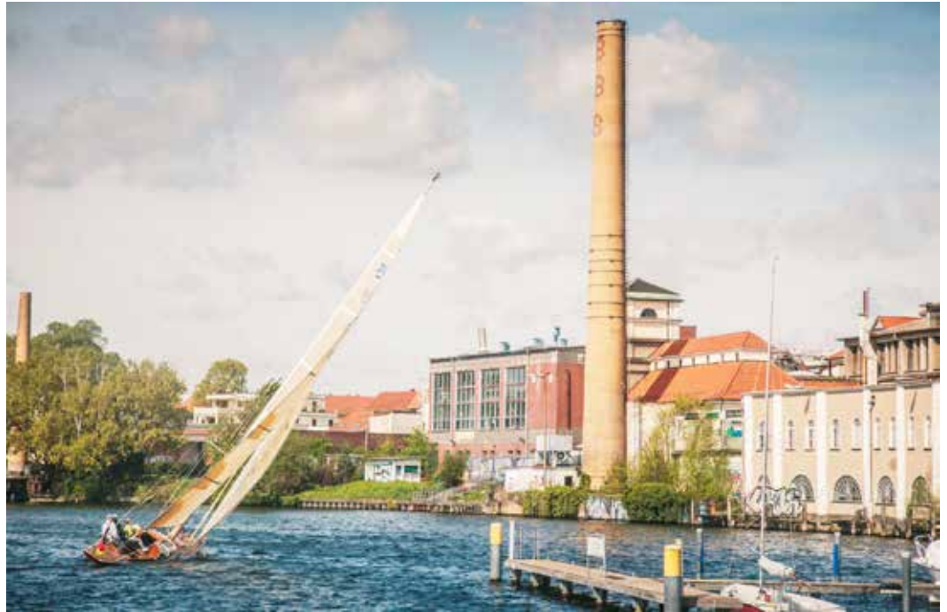
Sauberkeit, Sicherheit und Laustärke: Die Segelsaison ist eröffnet und mit steigenden Temperaturen füllen sich auch die Gewässer vor unserer Haustür immer mehr. Der Tourismusverein Berlin Treptow-Köpenick e.V. startet nun eine Aufklärungskampagne, um die Lebensqualität auch für Anwohner:innen und dort lebende Tierarten erhalten zu können.

Der Tourismusverein Berlin Treptow-Köpenick e.V. hat gemeinsam mit der Wirtschaftsförderung im August 2022 die Studie „Akzeptanz im Wassertourismus“ in Auftrag gegeben. Die Online-Befragung, an der sich mehr als 2500 Personen beteiligt haben, ergab, dass über 80% der Befragten die Gewässerfrequentierung für die Gewässer insgesamt als sehr hoch oder hoch einstufen. 94% der Befragten finden zudem, dass der Bootsverkehr in den letzten fünf Jahren gestiegen ist. Gut die